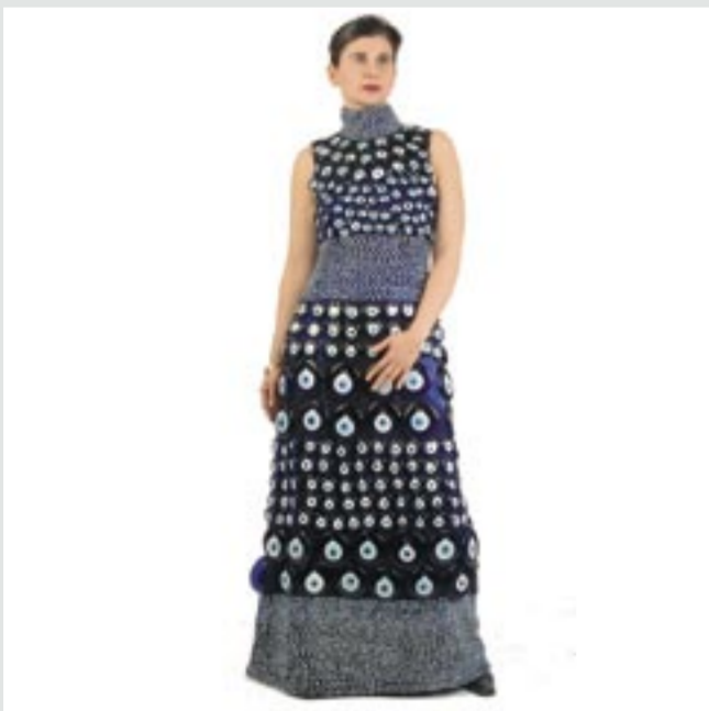
NEZAKET EKICI BERLIN NAZAR www.ekici-art.de

/THE CONCEPT OF SKULPTURALE HANDLUNGEN / ('sculptural narration') focuses on a specific aspect of performative sculpture. The common factor shared by the different presentations is that the artist's body is integrated in the sculpture, video or photographic work. The exhibition covers a variety of approaches ranging from sculptural performance to interactive sculpture.