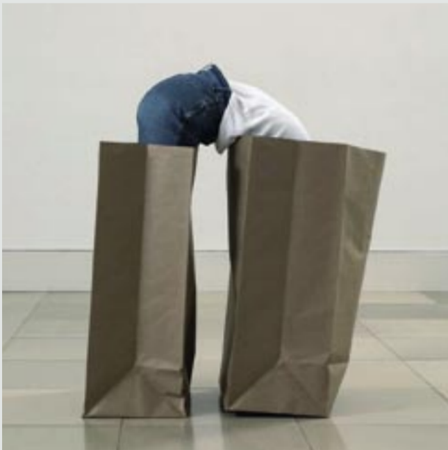
ANNE WODTKE MÜNCHEN SKULPTUR.sein www.annewodtke.de